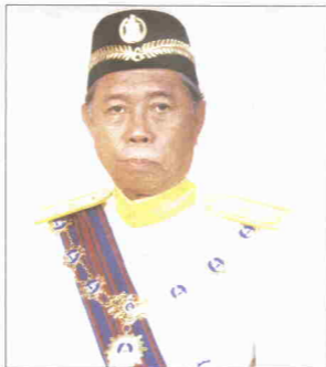
Tuan Yang Terutama Yang di-Pertua Negeri Sabah Tun Datuk Seri Panglima Haji Sakaran Dandai S.M.N., P.S.M., S.P.D.K., D.P.(SARAWAK), D.U.N.M.(MELAKA), P.G.D.K., A.D.K..J.P.